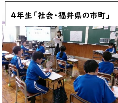
4年生「社会・福井県の市町」