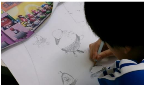
パオン学級「自立活動・課題と表現活動」