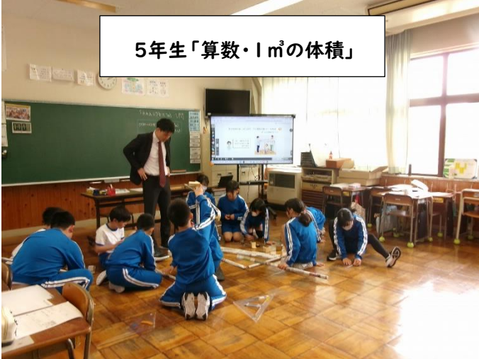
5年生「算数・1 m 3 の体積」