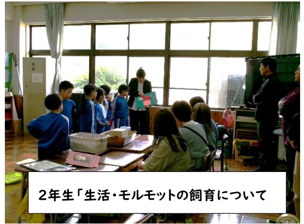
2年生「生活・モルモットの飼育について」