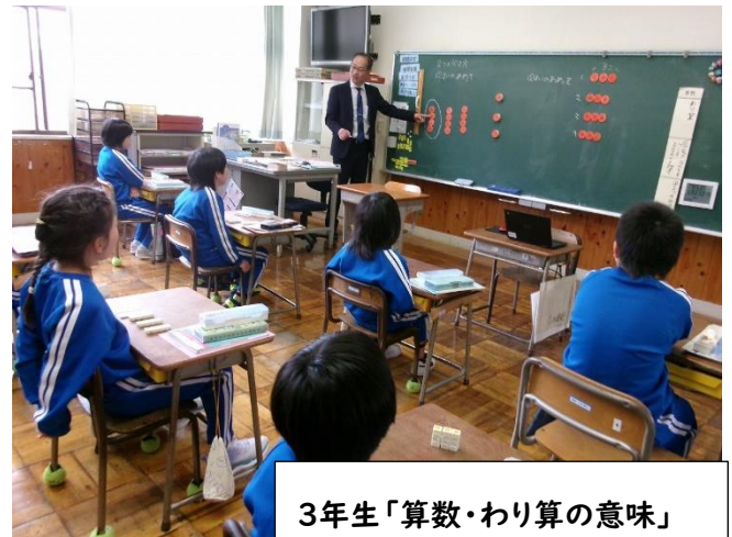
3年生「算数・わり算の意味」