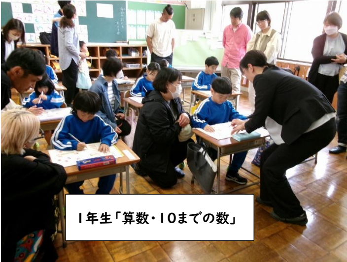
1年生「算数・10までの数」