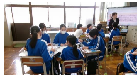
6年生「社会・選挙で代表者を選ぶ」