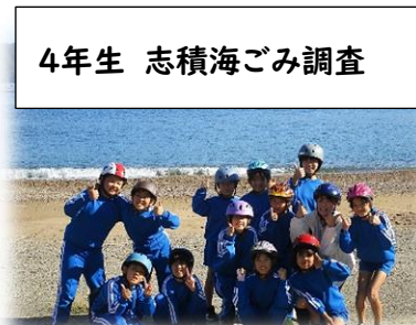
4年生 志積海ゴミ調査