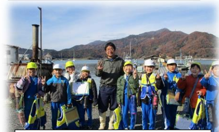
3年生 牡蠣・真珠養殖見学