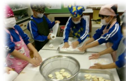
2年生 さつまいもチップス作り