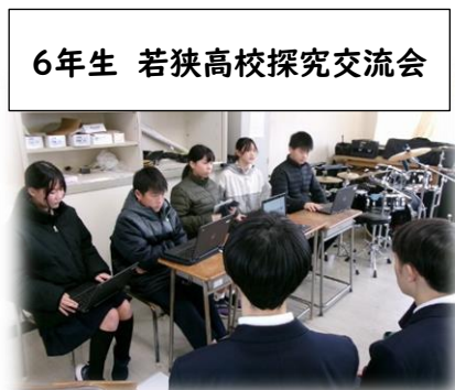
6年生 若狭高校探究交流会