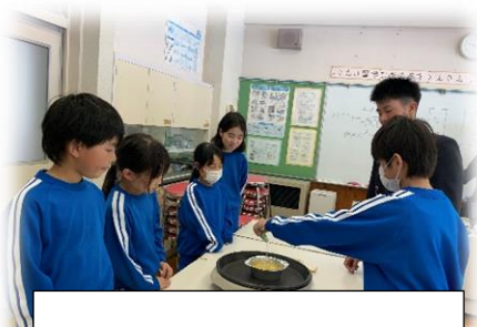
5年生 廃油キャンドル作り