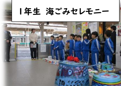
1年生 海ゴミセレモニー