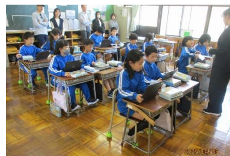
4年生「国語」漢字辞典の使い方