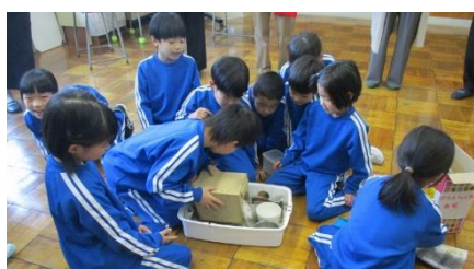
2年生「生活」モルモットのお世話説明