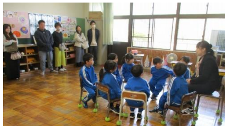
1年生「道徳」みんな DE トーク