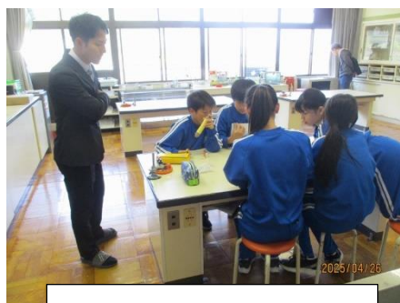
6年生「理科」気体の変化