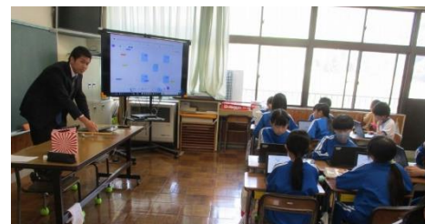
5年生「総合」年間の活動の話し合い