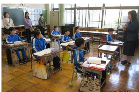
3年生「国語」登場人物の心情の変化