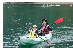
シーカヤック体験