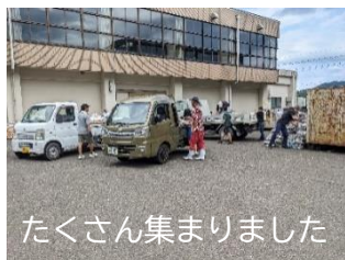
たくさん集まりました

6月16日(日)の資源回収では、保護者の皆様に大変お世話になりました。おかげさまで、たくさんの資源が集まりました。今回は、特にアルミ缶(一番お金になります!)が多く集まりました。収益は、子供たちの活動に有効に使わせていただきます。ありがとうございました。