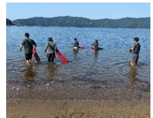
教職員による試泳

姿から、たくましさも感じ取る事ができます。当日は、みんなで励まし合ってそれぞれのコースを泳ぎ切って欲しいと願っています。1~4年生も7月10日(水)にチャレンジスイミングを予定しております。こちらも完泳を目指して頑張りたいです。ご声援よろしくお願い致します。