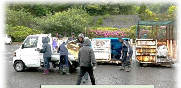
昨年度の活動の様子より

なお、早速、5/16(土)には第1回の「資源回収」と「奉仕作業」が計画されています。「資源回収」による収益は、子どもたちの教育活動資金として有意義に活用させていただいています。また、「奉仕作業」では、5/29(金)に開催する体育大会および練習等における子どもたちの安心安全な環境作りとして大変助かっています。併せて、普段できない校舎内外の清掃活動により子どもたちは快適な学校生活を過ごすことができます。このようにPTA活動が子どもたちに還元していただいていることに感謝申し上げます。