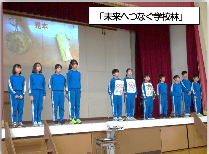
「未来へつなぐ学校林」