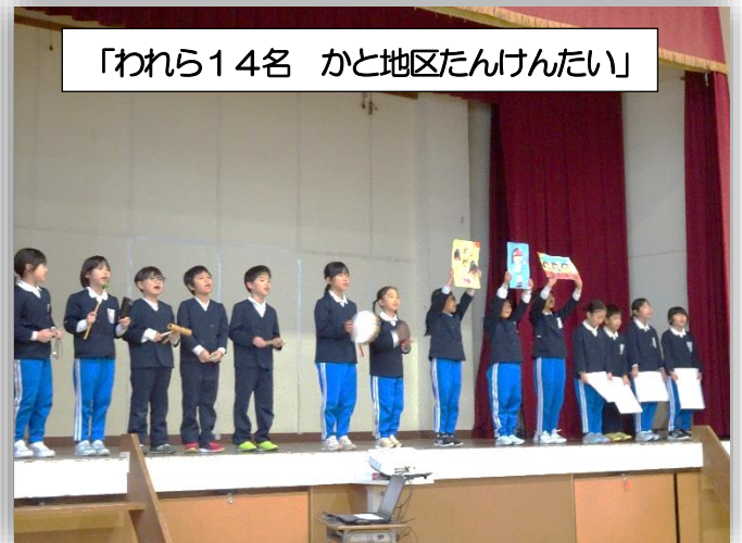
「われら14名 かと地区たんけんたい」