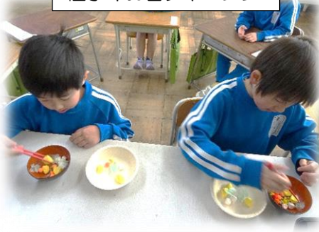
低学年お箸チャレンジ