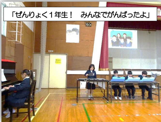
「ぜんりょく1年生！ みんなでがんばったよ」