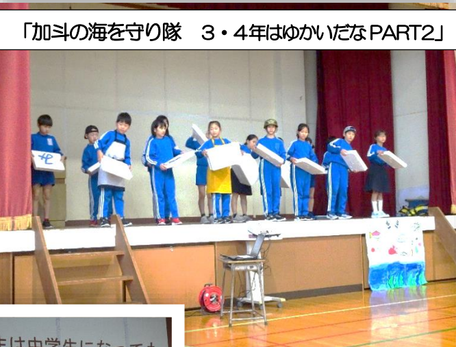
「加斗の海を守り隊 3・4年はゆかいだなPART2」