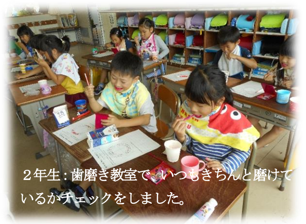
2年生：歯磨き教室で、いつもきちんと磨けているかチェックをしました。