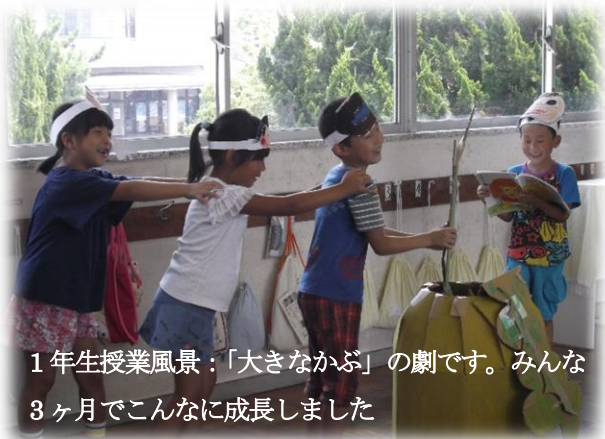
1年生授業風景：「大きなかぶ」の劇です。みんな3ヶ月でこんなに成長しました