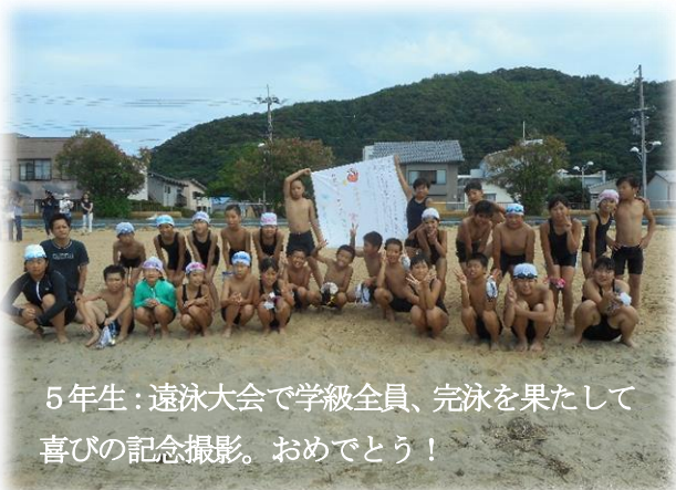
5年生：遠泳大会で学級全員、完泳を果たして喜びの記念撮影。おめでとう！