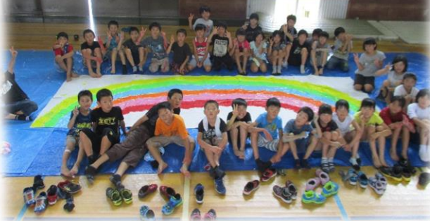
4年生：嶺南西特別支援学校との交流会でつくったアートの前で写真を撮りをパチリ！

毎日子ども達を見ていると、ベスト1がベスト7よりも上かということそうでもなくて、順番はどれも甲乙つけがたいものです。ほんの小さな日常の出来事ですが、学校での子ども達の生き生きした姿に、教師としての喜びを感じる毎日です。