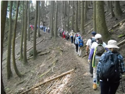
地域ボランティアや保護者ボランティアのサポートを得て、鯖街道体験学習にチャレンジ（6年）