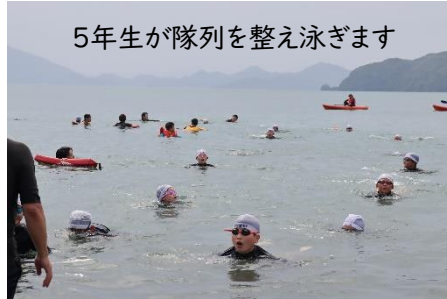
5年生が隊列を整え泳ぎます