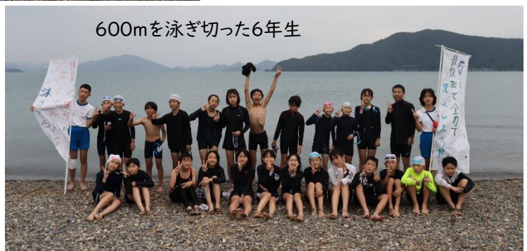
600mを泳ぎ切った6年生