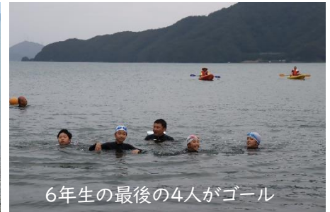
6年生の最後の4人がゴール