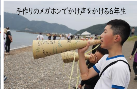
手作りのメガホンでかけ声をかける6年生