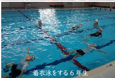
着衣泳をする6年生