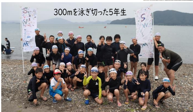
300mを泳ぎ切った5年生