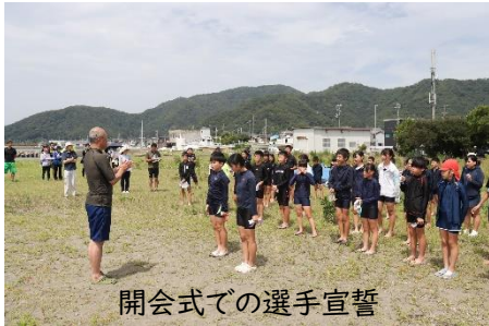
開会式での選手宣誓

保護者や地域の方々、水泳協会や県大ライフセービング部の方々と、本当に大勢の方々のご協力のおかげでこの遠泳大会を実施することができました。本当にありがとうございました。