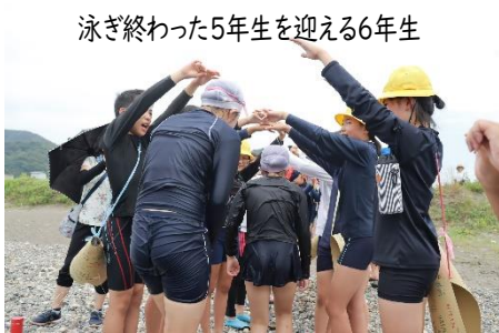
泳ぎ終わった5年生を迎える6年生