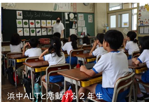
浜中ALTと活動する2年生