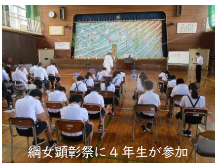
網女顕彰祭に4年生が参加