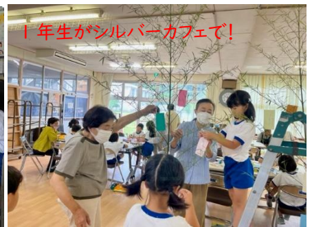
1年生がシルバークフェで!