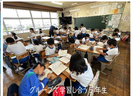
グループで学習し合う5年生