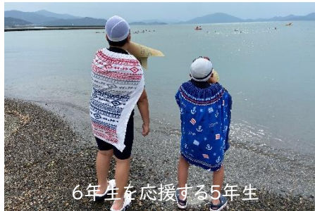
6年生を応援する5年生