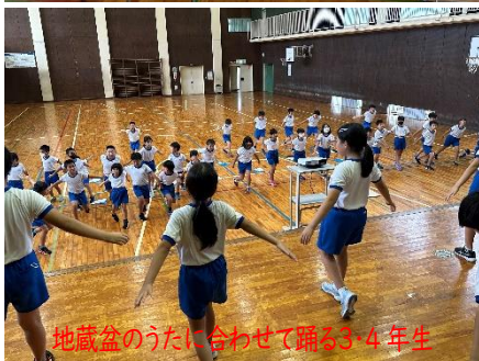
地藏盆のうたに合わせて踊る3・4年生