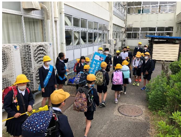
毎朝、「あいさつ元気頑張り隊」のメンバーが元気よくあいさつをして、みんなを迎えてくれています。