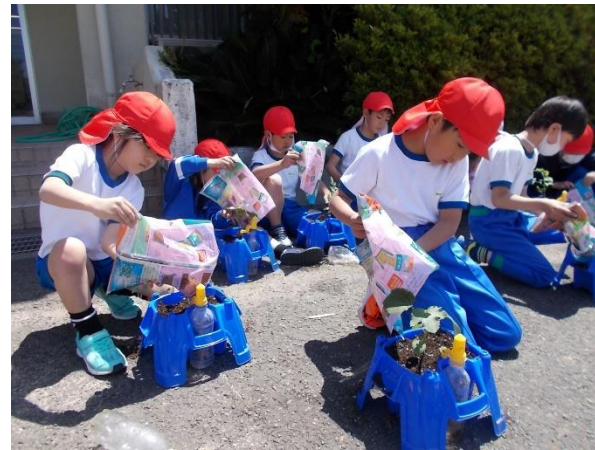
1年生はアサガオの種をまき、2年生は野菜の苗を植えました。水やりをして世話をしていきます。