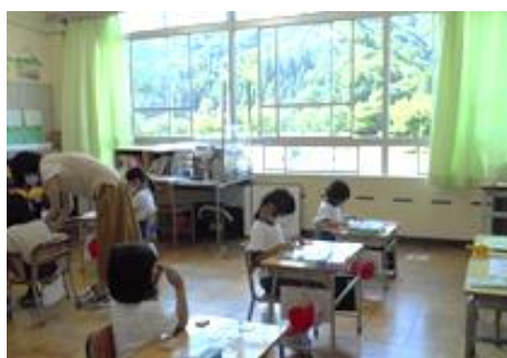
机と机の間隔をとり学習します