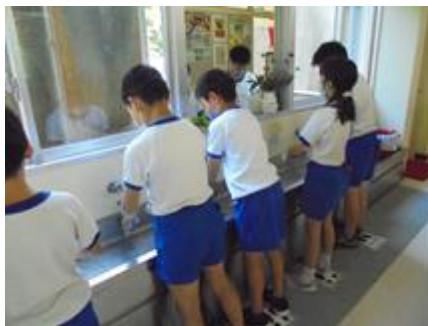
30秒間程度の手洗いをします