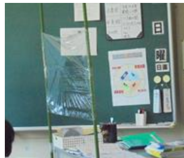
教員と話すときは、パーティション越しに話します