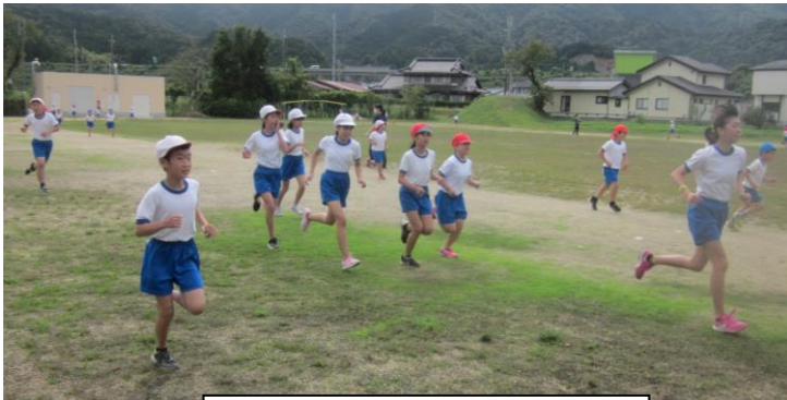
業間マラソン 激走5分間!

1日(木)から後期が始まりました。5日(月)に全校朝礼を行いました。後期のスタートの節目に当たり、「竹の節」の話をしました。竹は、節を作りながらたくましくしなやかにのびること、私たちも自分の節を作りながら、毎日成長していること、本気で何かに取り組んでいる時や躓いて困っている時に強い節を作るチャンス(竹の節チャンス)があること、後期は強い節を作るために「挑戦する心」を大切にに取り組むことの話をしました。今、21日(水)に行われるマラソン大会に向けて体育の時間や業間マラソンでがんばっています。中には朝や休み時間に進んで走っている子もいます。自分の目標に向かって挑戦し続けてほしいと思います。また、6年生は29日(木)・30日(金)に修学旅行(嶺北方面)に行きます。目的意識をしっかりと持って、修学旅行を通して大きな節を作って成長できるように有意義な時間にしてほしいと思います。がんばれ加斗っ子!