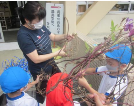
1年生 朝顔のつるでリース作り