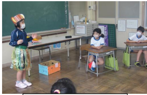
2年生 楽しい交流学習