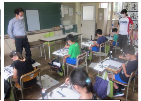
3年生 集中! 書写指導