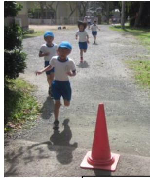
体育の時間も真剣勝負!